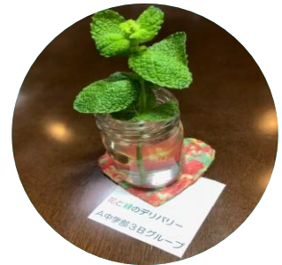
花と緑のデリバリー デスクに潤いを運んでくれる 生徒に感謝

学校は、子供にとっての学びの場であると同時に、保護者をはじめとする地域の皆様がコミュニティを形成する場でもあります。 比較的最近このコミュニティに加わった方には、まだ関わり方に戸惑う方もあることでしょう。それぞれ、いろいろ、お互いさま、です。安心できる場となるように、共通の体験を通し、知り合い、深め合ってまいりましょう。