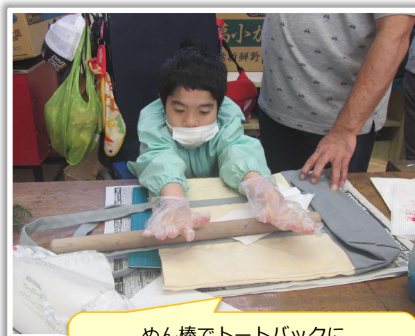
めん棒でトートバックに葉っぱを押し付けています☆

今回は、葉っぱスタンプアートでトートバックに模様を付ける体験を行いました。モミジなど、あきる野の自然の豊かさを象徴する様々な形の葉に、アクリル絵の具を付けてトートバックにスタンプします。色とりどりの葉脈が重なり合い、美しいアート作品かつ実用的なバックに変身！出来上がると、みんなでお互いの作品を見合って楽しみました。ぜひ大切に使ってくださいね。