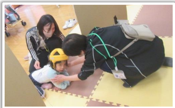
「かくれんぼ」の様子

「はらぺこ あおむし」の歌付き読み聞かせや「かくれんぼ」などを行っています。「かくれんぼ」では2つの段ボールついたての後ろに教職員が隠れ、音を頼りに探して、見つける活動をしています。ついたての後ろにいる教職員に気が付くと、意識して顔を見つめる様子も見られています。