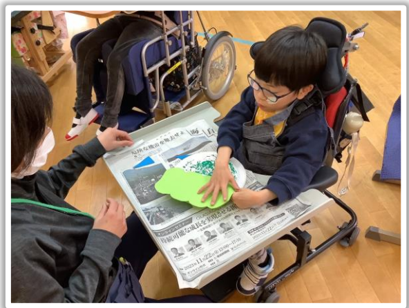
「鬼」の顔と髪をつけている様子

「鬼」を作りました。新聞紙スタンプを使って、絵の具の色を塗り重ねたり、「鬼」の顔と髪、角をテープで付けたりして、制作しました。みんなが意欲的に取り組み、個性的な「鬼」がたくさんできました。